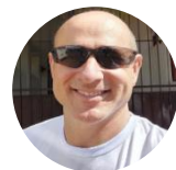
Direção de vídeo: Jorge Psidonik (UFFS)